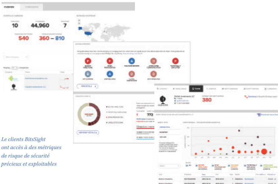
Les clients BitSight ont accès à des métriques de risque de sécurité précieuses et exploitables